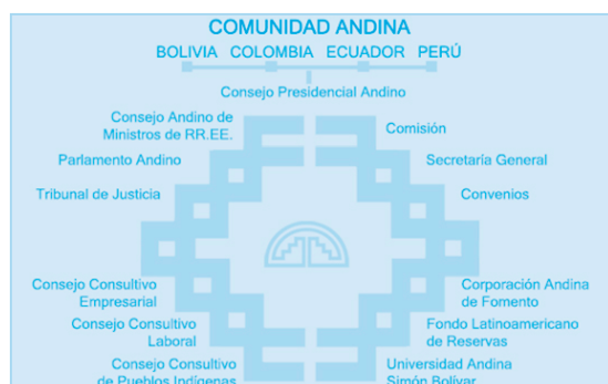
Figura 1. Organigrama del Pacto Andino